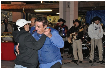
Couple enjoying the music festivities / Pareja disfrutando de las festividades al ritmo de la música