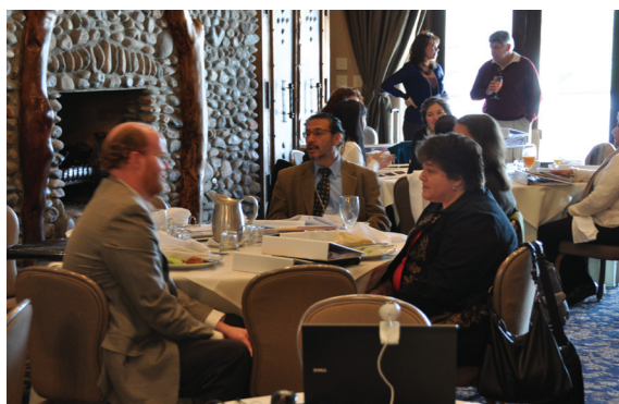
Leaders across Borders participants / Participantes de Líderes a través de las Fronteras

de Salud Pública de México en la Ciudad de México.