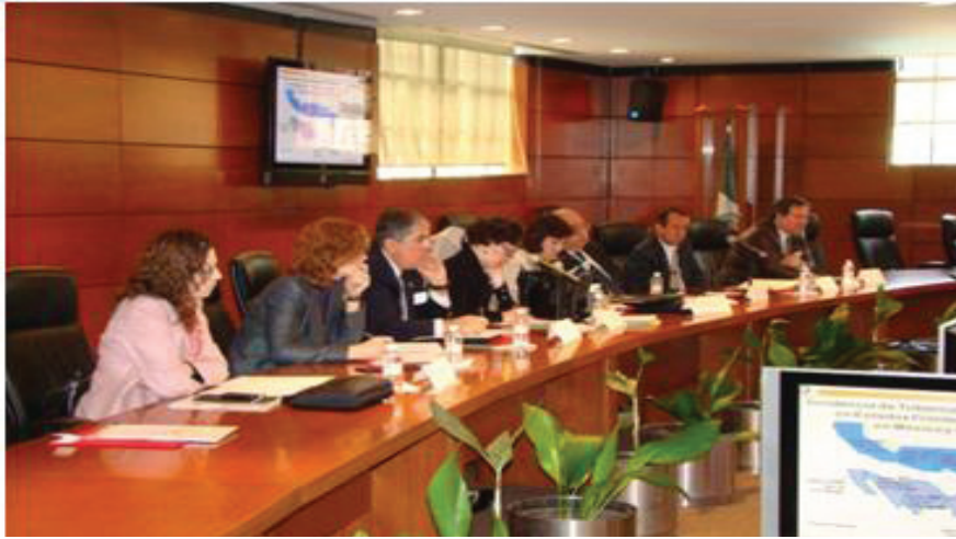
Participants at the TB Legal Issues Forum / Participantes del Foro sobre la Abogacía de la Tuberculosis, México