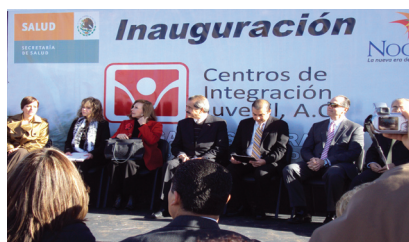
Principal attendees at the Youth Integration Center Inaugural / Invitados principales durante la Inauguración del Centro de Integración Juvenil

Las Ventanillas de Salud ofrecen información sobre clínicas de bajo costo, pláticas educativas sobre