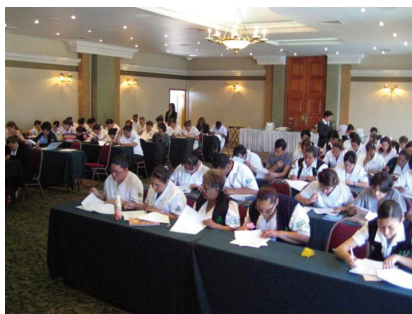
Nursing staff preparing for the Second Mexican National Health Week / Personal de enfermería en preparación para la Segunda Semana Nacional de Salud en México

La División de Salud Fronteriza de los Servicios de Administración y Recursos Humanos (HRSA por sus siglas) proporcionó apoyo para el evento y