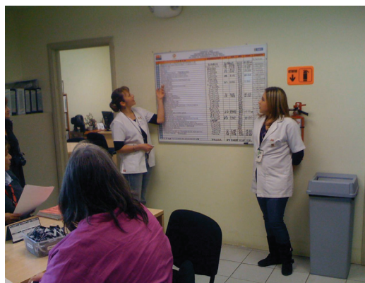
Visit to CAPASITS clinic and review of training programs / Visita a la clínica CAPASITS y reseña de los programas de capacitación

U.S. clinicians working within Immigration and Customs Enforcement (ICE) facilities in Texas, New Mexico, Arizona, and California.