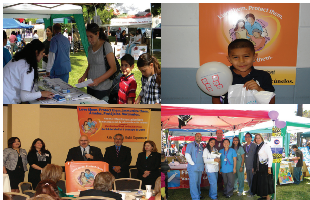
NIIW/VWA activities and participants at a glance / Actividades y participantes de la SNII en breve, California, Texas