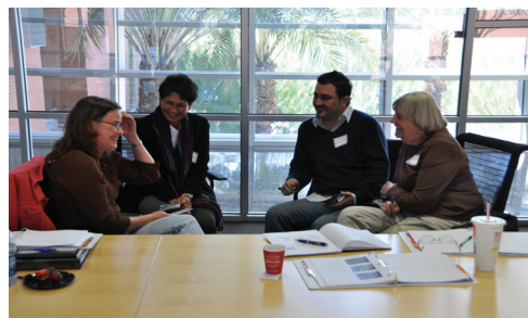
Leaders across Borders participants / Participantes de Líderes a través de las Fronteras

En marzo, se llevó a cabo una orientación en Tubac, Arizona, seguida por un retiro planeado para mayo en Hermosillo, Sonora.