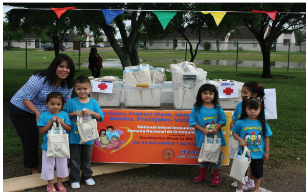
Head Start Program in Hidalgo County, Texas, participating in NIIW / El programa Head Start del Condado de Hidalgo, Texas, participando en la SNII

La ceremonia inaugural fue seguida por una conferencia profesional cuyo enfoque fue mejorar las estrategias de vacunación en la región fronteriza de México-Estados Unidos de Norteamérica, consistiendo en una