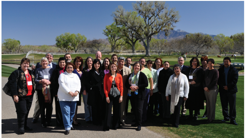
Leaders across Borders 2010 Cohort and program staff / Participantes y personal del programa de Líderes a través de las Fronteras 2010, Tubac, Arizona

Participants represent many aspects of public health and health care along the border, including leaders from the public health sector and