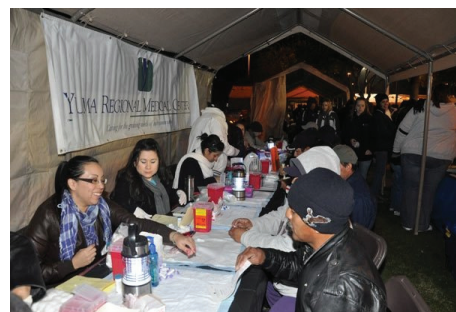
Campesinos Sin Fronteras (CSF) staff performing cholesterol testing / Personal de la CSF practicando pruebas de colesterol

La celebración del 15vo Día Anual del Campesino se celebró el 5 de diciembre de 2009, en el Condado de Yuma en el Friendship Park (Parque Amistad) de esta ciudad fronteriza de Arizona.