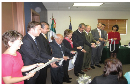
Principal attendees at the Ventanilla de Salud Ribbon Cutting Ceremony / Invitados principales durante la Ceremonia del Corte de Listón de la Ventanilla de Salud, Nogales, Arizona

The Ventanillas de Salud provide information on low-cost clinics, health education on preventive